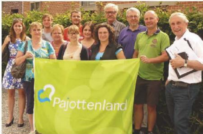
Verras de organisatie met een leuk voorstel

Bever, Galmaarden, Gooik, Herne, Lennik en Roosdaal organiseren samen met Pajottenland+ in de lente van 2015 het 'weekend van de volkscafés'. Hiermee willen ze in het verlengde van de 1 mei-weekend de lokale herbergen ondersteunen. Dit evenement sluit aan bij de VTM-serie 'Amateurs', die in de herfst van dit jaar wordt uitgezonden. Het doel is om in cafés vertel- en zangavonden te organiseren, naast tentoonstellingen en andere gezellige activiteiten. Amateurs draait rond de toneelvereniging 'De Pajotters'. Er zal dan ook amateurtoneel aan bod komen.